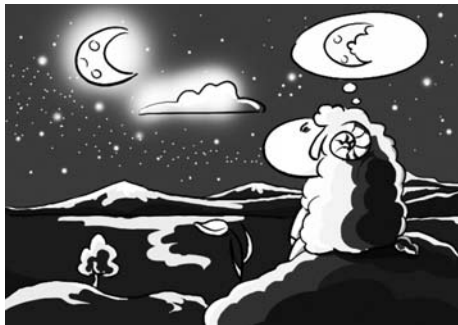
Рис. Юлии Ждановой

– А можно я останусь у вас? Луна далеко, и я даже не знаю, вкусная ли она. А вот ваши хлеб, сыр и вода такие вкусные! А взамен я могу давать вам шерсть.